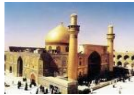
بارگاه مطهر امام علی علیه السلام در نجف