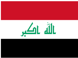
پرچم کشور عراق